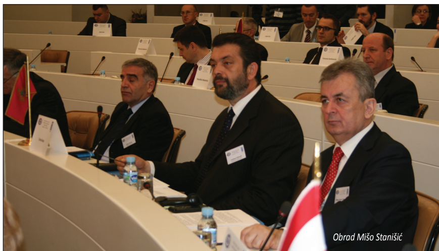
Obrad Mišo Stanišić

„Vrhunac te suradnje je to što su naši vojnici - pripadnici oružanih snaga Crne Gore i Hrvatske - zajedno otputovali u Mirovnu misiju u Afganistan“, zaključio je Stanišić.