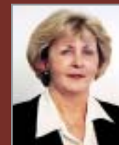
BRANKA TODOROVIĆ Tajnica Predstavničkog doma