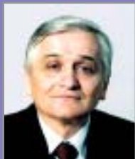
NIKOLA ŠPIRIĆ predsjedava Domom VIII.2003.-IV.2004. VIII.2005.-IV.2006.