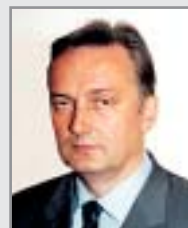
ZLATKO LAGUMDŽIJA 1955. Sarajevo dr. elektroteh. znanosti i informatike prof. sveučilišta SDPBIH