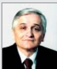
NIKOLA ŠPIRIĆ 1956. Brda Drvar, Drvar dr. ekonomskih znanosti prof. sveučilišta SNSD