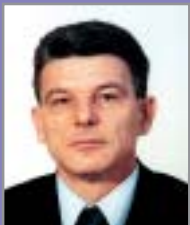
ŠEFIK DŽAFEROVIĆ predsjedava Domom XII.2002.-VIII.2003. XII.2004.-VIII.2005.