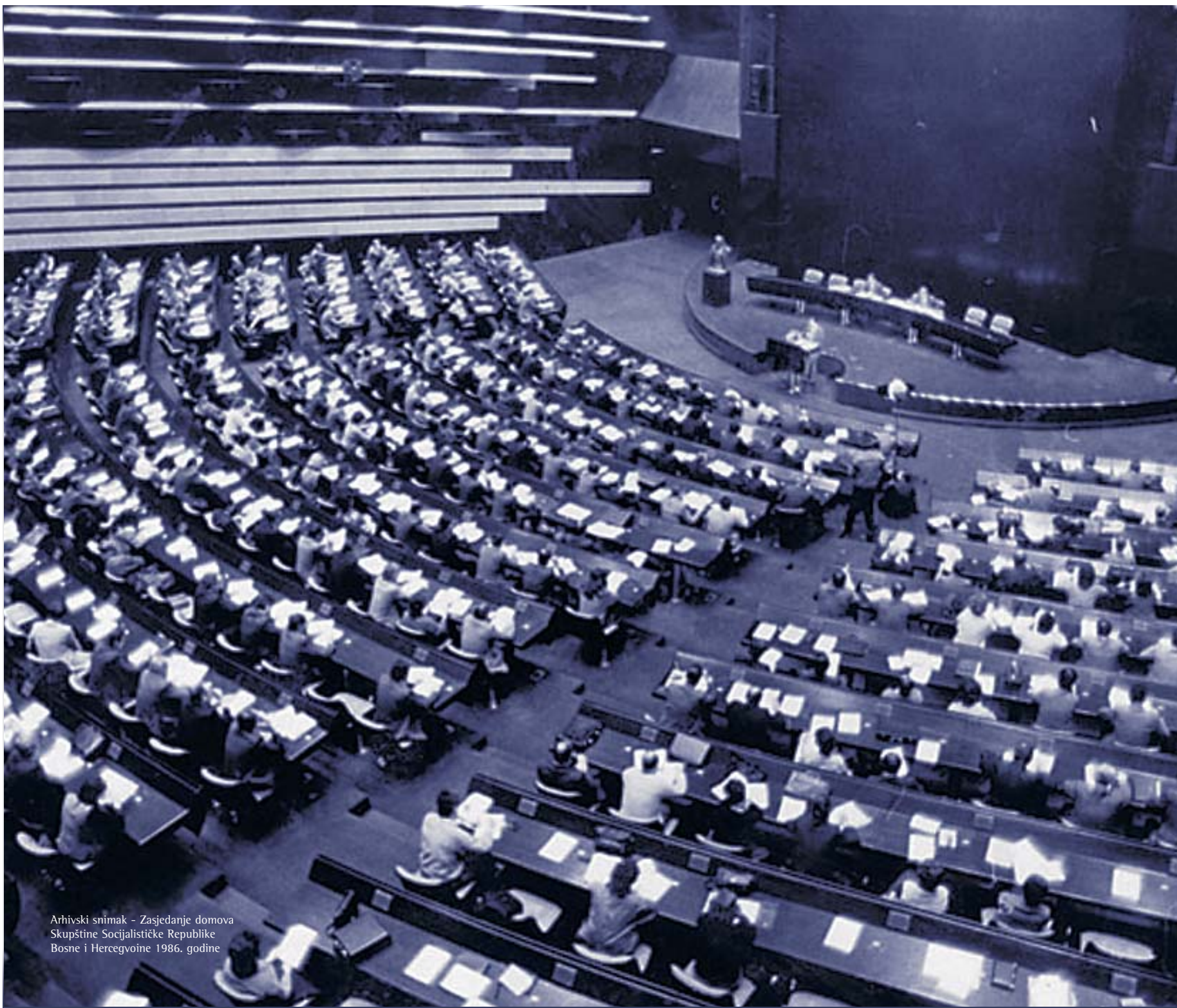
Arhivski snimak - Zasedanje domova Skupštine Socijalističke Republike Bosne i Hercegovine 1986. godine