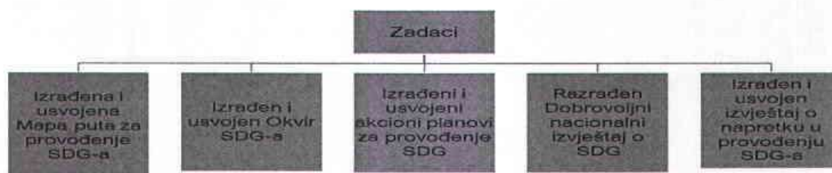
Grafikon 1. Zadaci Radne grupa za planiranje provođenja Ciljeva održivog razvoja u BiH