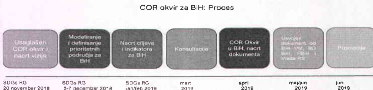
Slika 2. Pregled aktivnosti na izradi Okvira Ciljeva održivog razvoja

Ova radna podgrupa održala je prvi sastanak krajem oktobra 2018. godine i od tada se sastajala nekoliko puta u cilju definisanja sadržaja dokumenta. Vremenski rokovi koji su postavljeni za izradu ovog dokumenta mijenjani su, i predstavljeni su u nastavku u grafikonu.