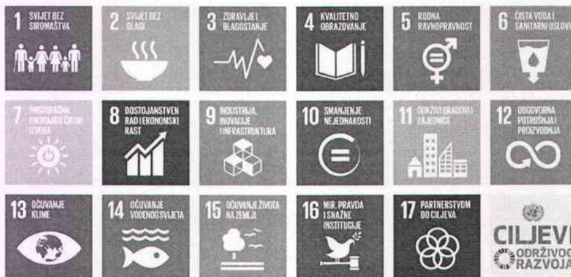
Slika1. Ciljevi održivog razvoja