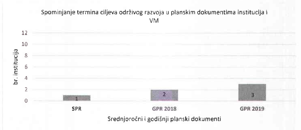
Dijagram 1. Broj institucija koje u planskim dokumentima spominju Ciljeve održivog razvoja

Dalje, Ured za reviziju je na uzorku institucija analizirao 32 da li institucije u srednjoročnim programima rada (SPR) i godišnjim programima rada (GPR) za 2018. i 2019. godinu pominju termine "ciljevi održivog razvoja" ili "Agenda 2030". Rezultati su prikazani u dijagramu.